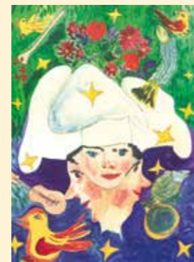
»Musizierende Köche« Lenka Hansen-Mörck Farblithographien an unserer Rezeption erhältlich